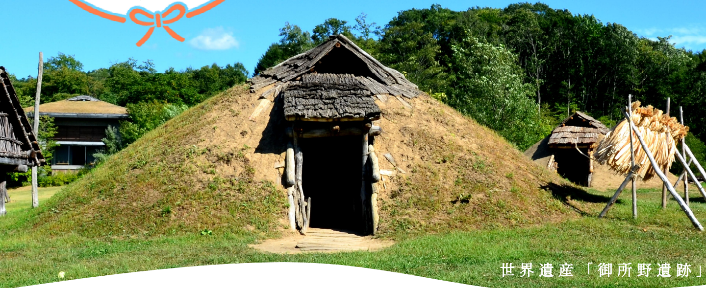
世界遺産「御所野遺跡」